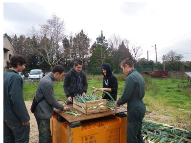
Préparation des légumes du potager de Pétrarque, septembre 2011