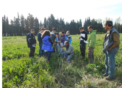
Activités pédagogiques sur le verger-maraîcher (sur-greffage), avril 2012